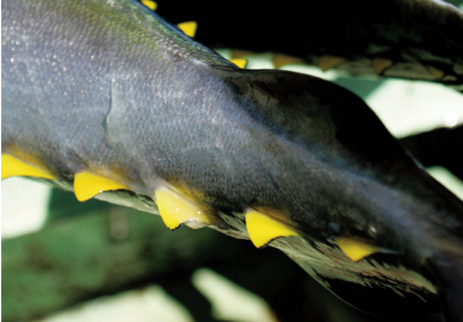
Tonno pinna gialla pescato con palamiti dal peschereccio giapponese, Yusei maru No8, nelle acque della Micronesia.

Tutti i 23 stock di tonno sono sottoposti a un intenso sforzo di pesca, anche risorse per il momento in buono stato, come il tonnetto striato. In particolare, vi è preoccupazione per la conservazione degli stock di pinna gialla. Vi sono segni di declino delle risorse e, come sostiene il programma Seafood Watch del Monterey Bay Aquarium, è probabile che il sovrasfruttamento sia ormai diffuso in tutti gli oceani 7 . Secondo il Codice di Condotta FAO per la Pesca Responsabile, tanto sbandierato ma raramente applicato, la gestione della pesca dovrebbe essere basata sul principio di precauzione. Se così fosse, lo stato attuale degli stock di pinna gialla avrebbe da tempo dovuto far scattare misure gestionali restrittive per garantire la sostenibilità della pesca. Purtroppo la mancanza di una gestione efficace e l'utilizzo diffuso di metodi di pesca che catturano esemplari immaturi minacciano il tonno preferito dagli Italiani.