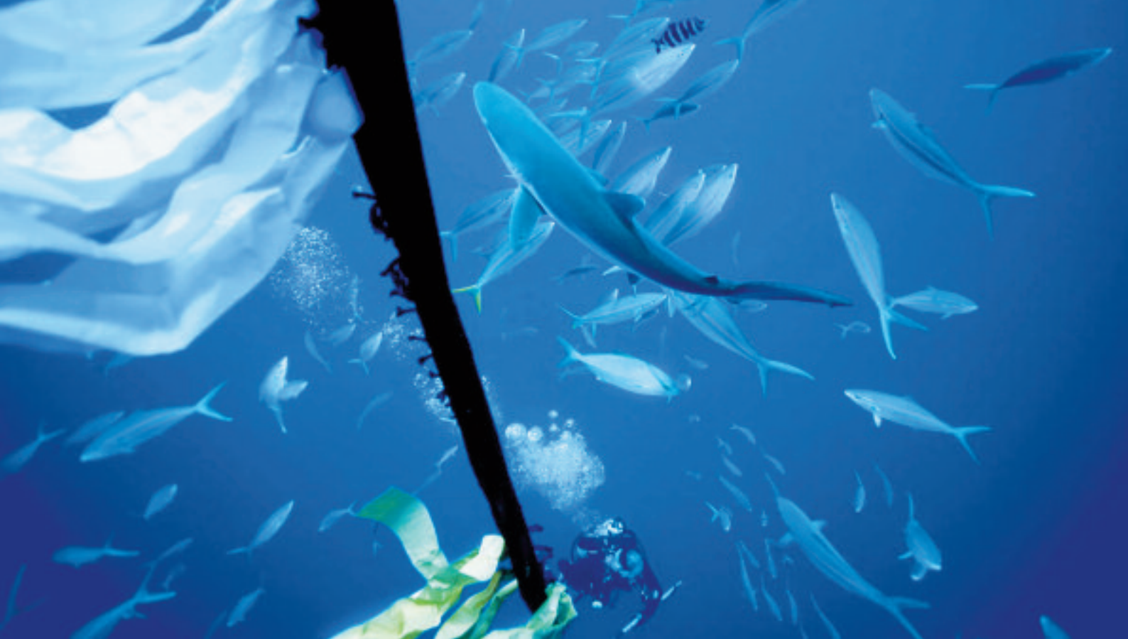
Uno squalo attirato dalla presenza di un FAD, rischia di essere catturato dalle flotte che pescano tonni. Oceano Pacifico, 2009.