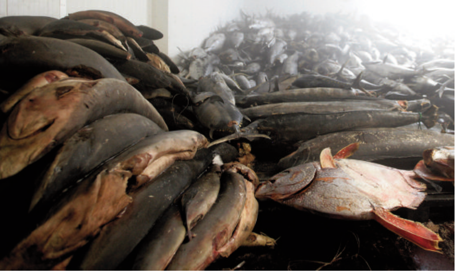
La stiva dell'Albatun Tres piena di tonni e altre specie, catture accessorie delle attività di pesca.