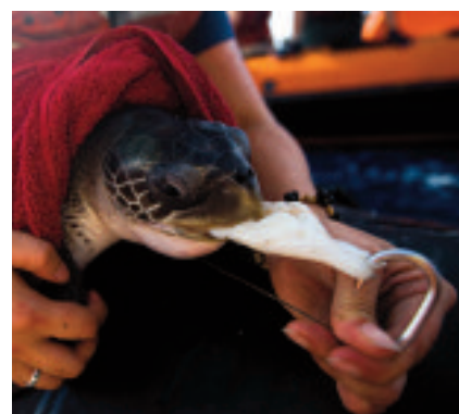
In alto: Pinne di squali catturate con palamiti appese a seccare sul ponte del peschereccio Win Full 6. Acque internazionali, Oceano Pacifico.