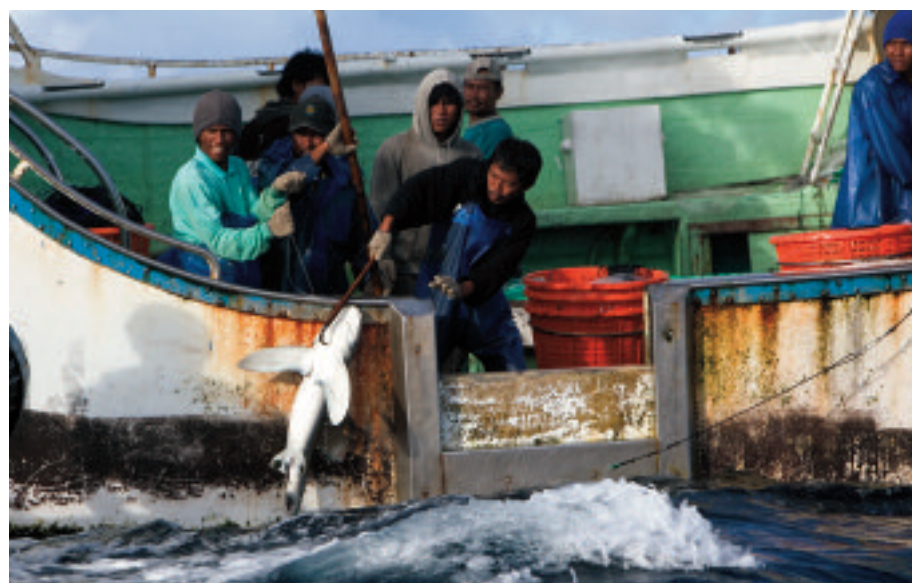
Membri dell'equipaggio del peschereccio Taiwanese Ho Tsai Fa 18 portano a bordo uno squalo pescato con palamito. Oceano Pacifico, Maggio 2008.

Le pinne dorsali possono essere vendute a prezzi molto alti in paesi dove la zuppa di pinne di squalo è considerata una prelibatezza. Nell'Oceano Pacifico Centrale e Occidentale, la mortalità totale di squali è stata stimata intorno ai 500 000 -1,4 milioni di esemplari l'anno sulla base di dati raccolti da osservatori a bordo di pescherecci che utilizzano palamiti 20 .